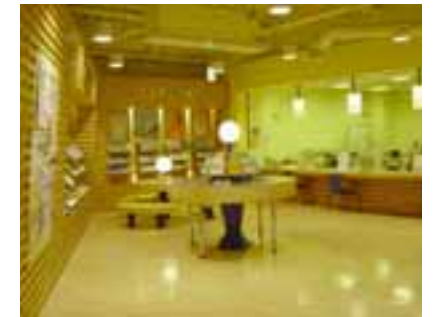
サービス窓口「役所屋」の様子

役所屋のように市民にとって利便性の高い仕組み(インフラ)があってこそ、新サービス(IT)が生きる。形式上は新サービスも電子申請の一種といえるが、携帯電話と身分証による個人確認で安全性は担保されている。住基カードがフォーマルなら、いわばカジュアルな個人認証だが、本質は変わらない。企画調整部情報政策課インターネ