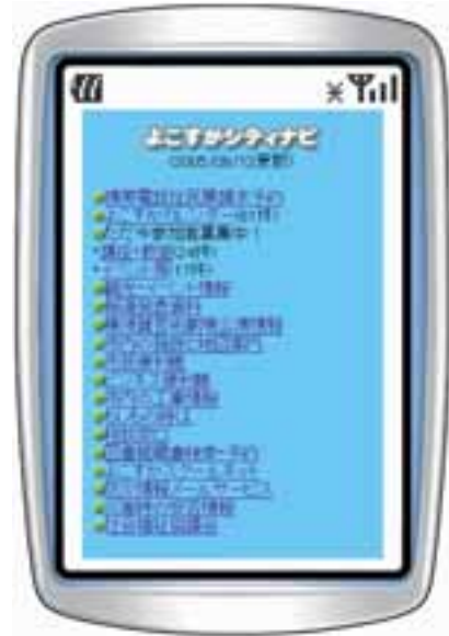
「よこすかシティナビ」のメニュー画面

き下げた上で、業務の効率化を狙い電子入札に踏み切った。ITを目的ではなく手段として活用している。